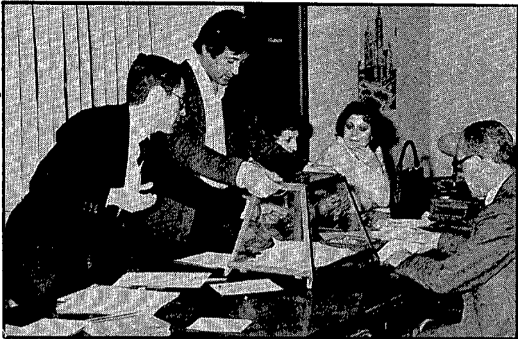
El momento del escrutinio de votos.