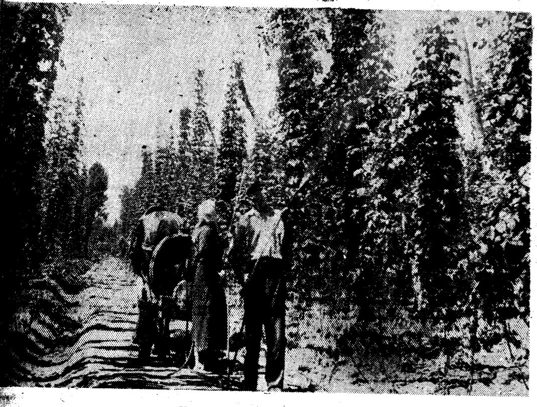
Tratamiento contra plagas del lúpulo.